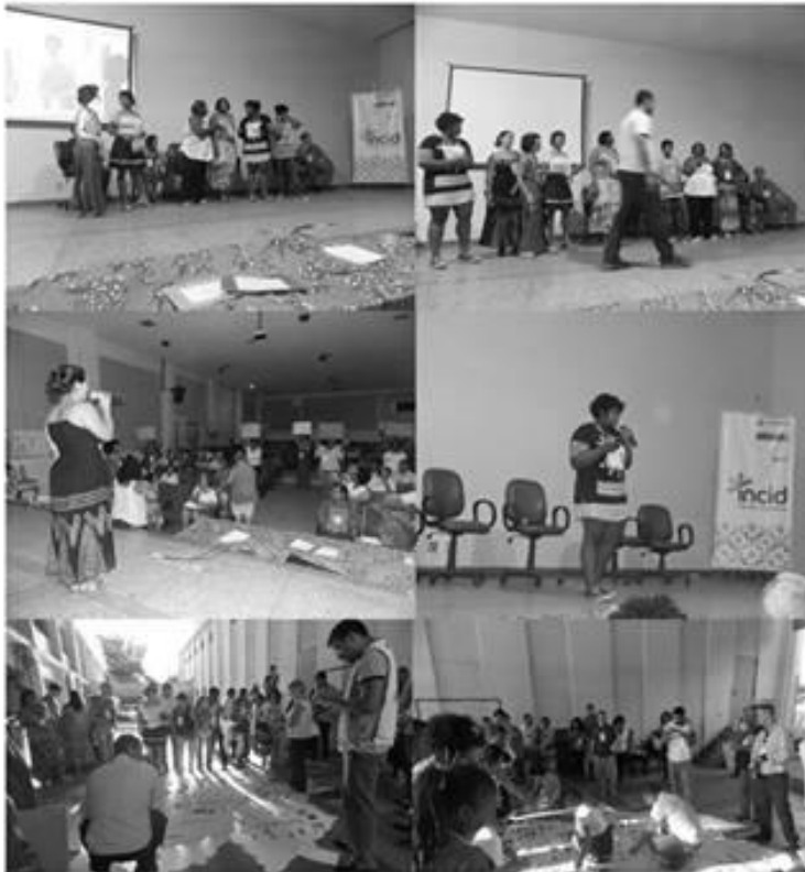
O encontro ocorreu na UERJ de São Gonçalo

O III Encontro do Fórum de Cidadania Ativa , realizado entre as Redes de Cidadania Ativa dos 14 municípios da área de atuação do INCID, aconteceu no dia 30 de Janeiro de 2016, no município de São Gonçalo. O evento abordou temas importantes para o grupo, como Direito à Educação, Saúde, Agricultura Familiar, ao Meio Ambiente e Direito à Vida Segura das Mulheres. Todos os temas foram apresentados e discutidos por Grupos de Trabalho (GT's), formados no II Encontro do Fórum, ocorrido em Itaboraí.